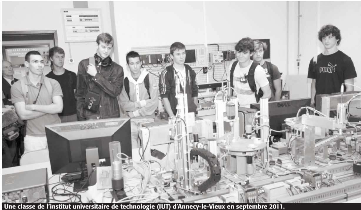
Une classe de l'institut universitaire de technologie (IUT) d'Annecy-le-Vieux en septembre 2011.