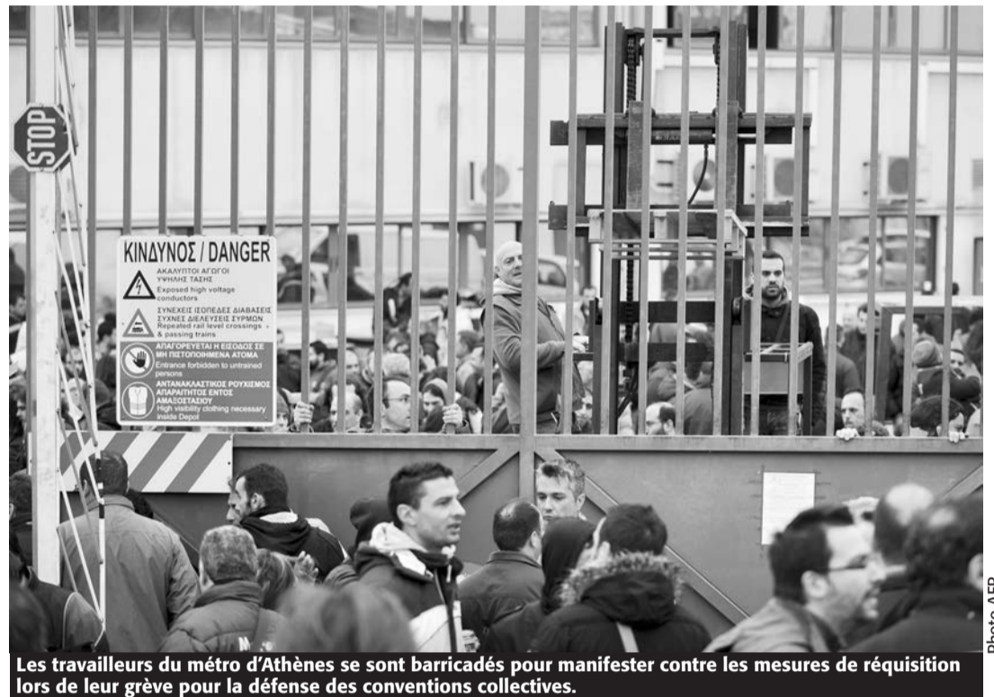
Les travailleurs du métro d'Athènes se sont barricadés pour manifester contre les mesures de réquisition lors de leur grève pour la défense des conventions collectives.

En mai, c'est contre les enseignants du secondaire, appelés à la grève par OLME le 17 mai, que le gouvernement Samaras a utilisé la réquisition. Mais cette fois-ci, c'est avant même que la grève ne soit formellement votée dans les assemblées régionales du syndicat réunies le 14 mai que chaque enseignant grec a reçu, la veille, la visite de la police venue lui remettre son ordre de réquisition. Dès lors, comme l'a dit une enseignante dans l'une de ces assemblées, s'adressant aux dirigeants : « Comme les collègues venus ce soir, je suis pour la grève le 17. Mais aujourd'hui, on nous demande de nous prononcer sur une grève dont tout le monde sait ici que nous n'avons pas les