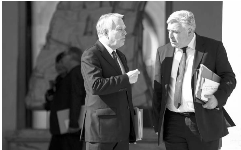
Jean-Marc Ayrault et Frédéric Cuvillier, ministre des Transports, à l'issue d'une réunion de cabinet, sur le perron de l'Élysée le 22 mai.

Oui, c'est bien l'éclatement de la SNCF. Les organisations syndicales ont parfaitement raison. Et à cela s'ajoute la création d'un décret-socle sur les conditions de travail, qui serait commun à toutes les entreprises ferroviaires, remettant en cause l'existence de l'actuelle réglementation du travail (RH 0077). Il mettrait également en place une conven-