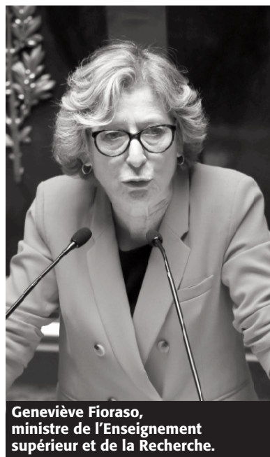
Geneviève Fioraso, ministre de l'Enseignement supérieur et de la Recherche.