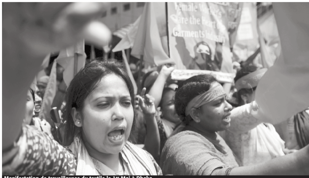
Manifestation de travailleuses du textile le 1 er Mai à Dhaka.

Au lendemain de l'effondrement d'un atelier de textile à Savar, près de Dhaka, qui a fait plus de 1 000 morts et 2 000 blessés, trente et une multinationales signent un accord concernant le textile au Bangladesh. De quoi s'agit-il ?