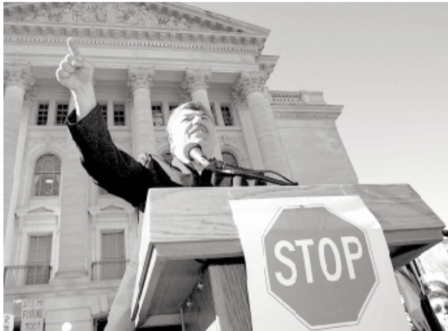
Richard Trumka, président de la centrale syndicale AFL-CIO.