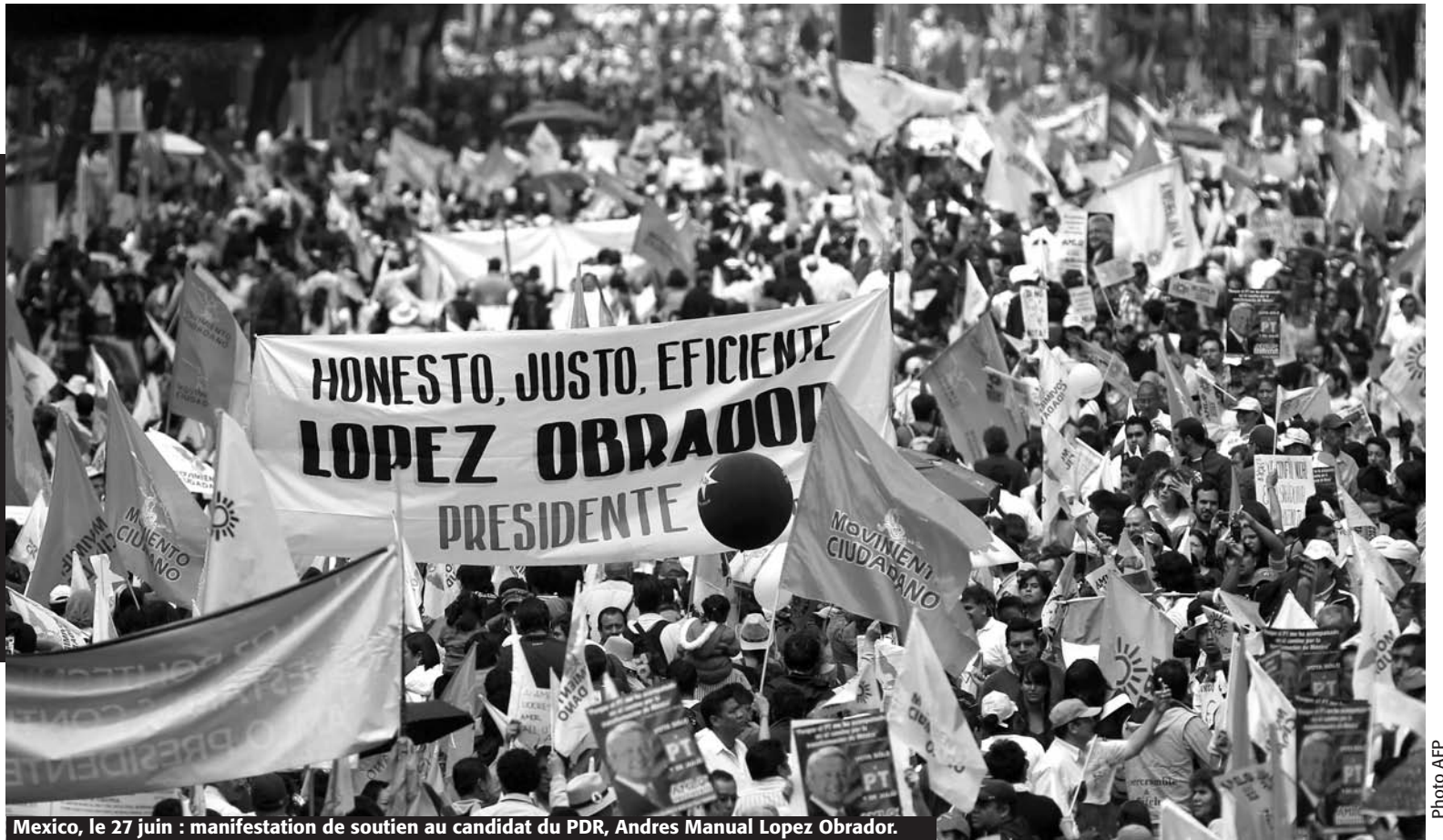
Mexico, le 27 juin : manifestation de soutien au candidat du PDR, Andres Manuel Lopez Obrador.