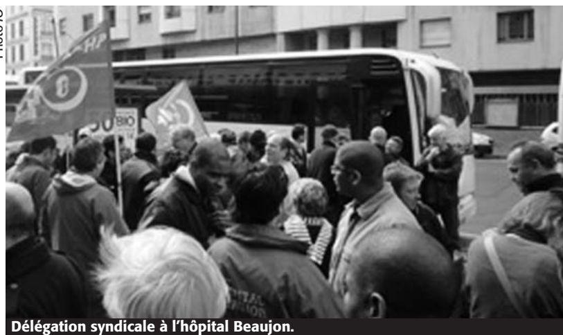
Délégation syndicale à l'hôpital Beaujon.

La question va se trouver posée immédiatement dans les autres établissements, et pour tous pour la prime de décembre.