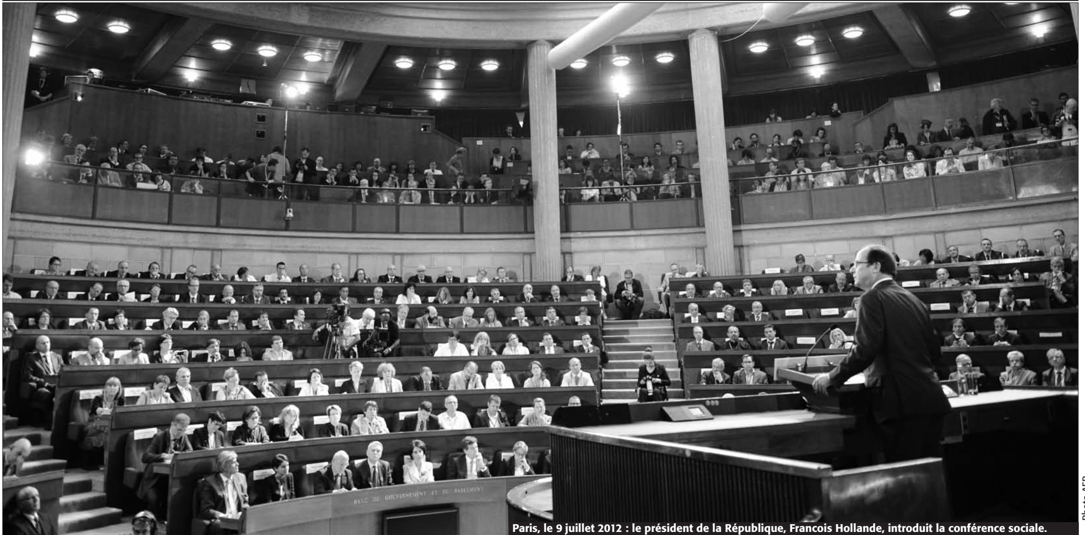
Paris, le 9 juillet 2012 : le président de la République, François Hollande, introduit la conférence sociale.