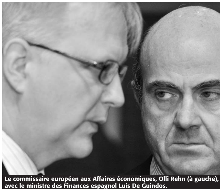
Le commissaire européen aux Affaires économiques, Olli Rehn (à gauche), avec le ministre des Finances espagnol Luis De Guindos.

« Le consensus parmi les observateurs est que l'Union européenne a fait un pas important dans la bonne direction en décidant d'une démarche visant à une union bancaire, mais qu'elle n'est cependant pas allée assez loin pour trouver une solution à la crise. Je suis en désaccord avec cette appréciation. Un grand pas a, en effet, été franchi, mais dans la mauvaise direction (...). Il a été admis qu'il n'y aurait pas de recapitalisation bancaire commune tant qu'une union bancaire effective ne sera pas établie, et la Bundesbank nous a rappelé que cela n'est pas possible sans une union politique. La conclusion logique, c'est qu'il n'y aura pas de solution à la crise avant vingt ans (...). »