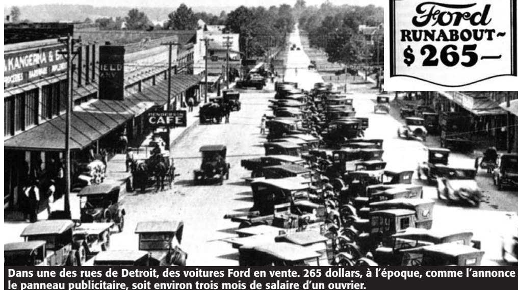
Dans une des rues de Detroit, des voitures Ford en vente. 265 dollars, à l'époque, comme l'annonce le panneau publicitaire, soit environ trois mois de salaire d'un ouvrier.