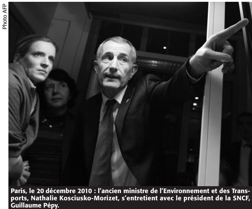
Paris, le 20 décembre 2010 : l'ancien ministre de l'Environnement et des Transports, Nathalie Kosciusko-Morizet, s'entretient avec le président de la SNCF, Guillaume Pépy.

Ces assises, qui ont réuni les patrons d'entreprises ferroviaires, les dirigeants de la SNCF et de RFF, les associations d'usagers, les élus politiques et les syndicats, se sont tenues de la mi-septembre à décembre 2011.