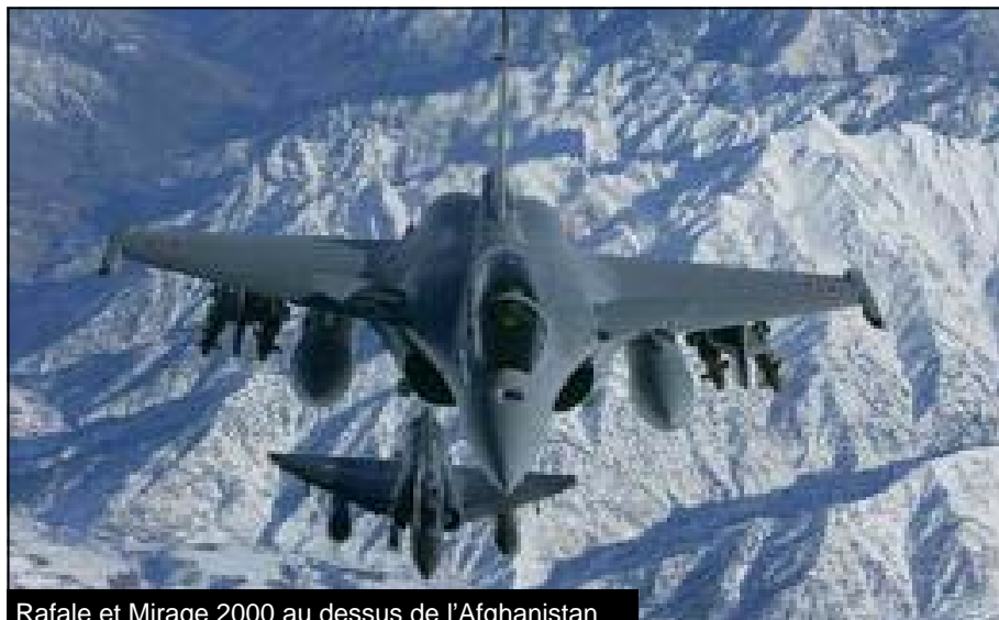
Rafale et Mirage 2000 au dessus de l'Afghanistan

va recruter 15 000 nouveaux soldats par an dans les prochaines années.