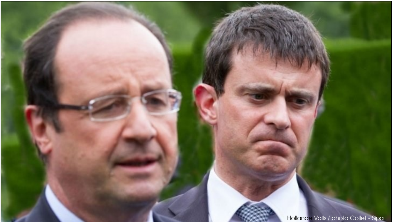
Hollande Valls