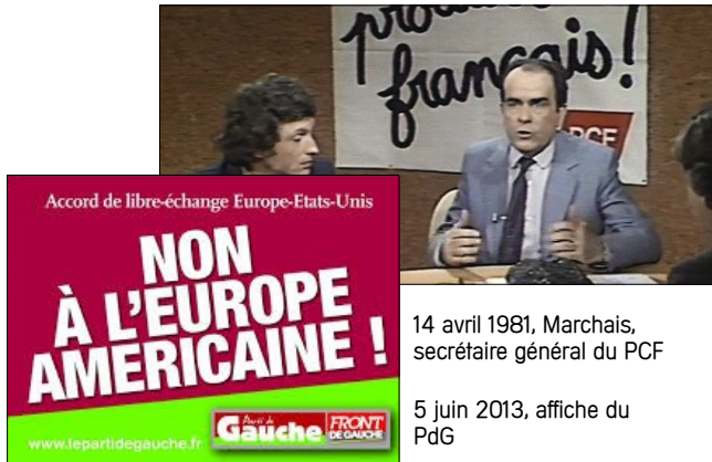
14 avril 1981, Marchais, secrétaire général du PCF