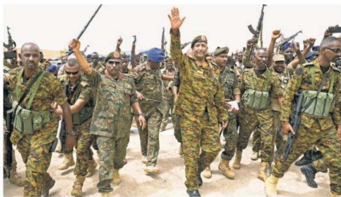
Sudanese army chief Abdel Fattah al-Burhan visited the Flamingo Marine Base in Port Sudan in August. The military has been battling Sudanese rebels, known as the Rapid Support Forces, that are backed by Russia's Wagner paramilitary group.

With fighting in Ukraine at a near stalemate, a global battle over weapons and eco-