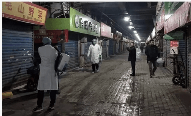
The Wuhan seafood market, which is at the centre of the pneumonia outbreak, has been closed.

Une nouvelle étude chinoise indique que le nouveau coronavirus n'est pas originaire du marché des fruits de mer de Huanan. Source: Global Times Publié : 2020/2/22 20:14:18