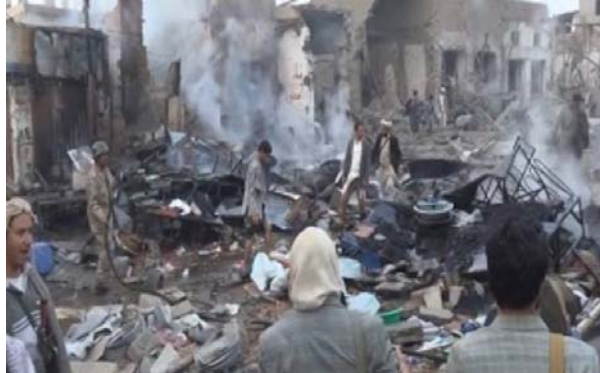
( http://arretsurlinfo.ch/wp-content/uploads/2015/08/yemen-12-a-800x500_c.jpg )

Tweet Tweet ( http://twitter.com/share ) ? 4