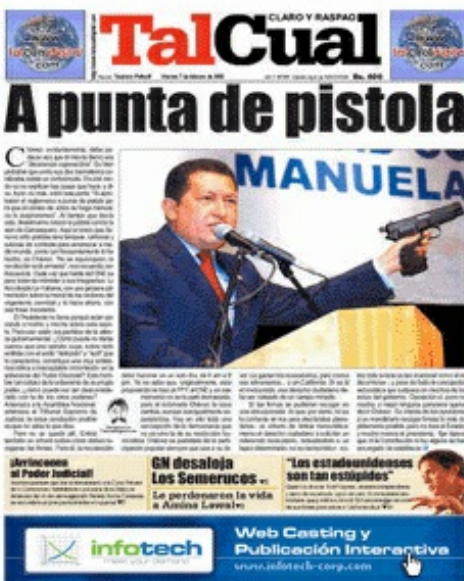
Portada del diario Tal Cual del jueves 25 de septiembre de 2003

Mélenchon, Pierre Laurent ou Olivier Besancenot, Tsipras, Maduro, Raul Castro (qui a cessé d'être un dictateur dans nos médias depuis qu'Obama lui faisant des rissettes, il convient de l'appeler désormais « le président Raul Castro »).