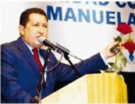
Foto original de Venpres. Fue publicada ayer por el Diario Panorama, página 1-12.

Cela signifie que, en principe , vous ne verrez pas en une du GS un article contre les syndicats, contre les partis de gauche (j'ai dit de gauche et je me comprends), contre les pays qui luttent pour leur indépendance (Cuba, le Venezuela, la Bolivie, etc.), contre Jean-Luc