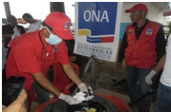
Lutte contre le narcotrafic au Venezuela Image du travail quotidien des forces de sécurité de l'Etat (Mars-Avril 2015)

Vous verrez aussi qu'au nord-ouest de l'Amérique du Sud se trouve la Colombie, considérée comme l'un des plus grands producteurs de drogue dans le monde. Vous constaterez donc que la Colombie partage sa frontière avec le Venezuela, une nation qui se trouve presque au milieu d'une ligne directe imaginaire entre la Colombie et les États-Unis. Sachant que le Venezuela n'est pas un pays producteur de drogue, que la Colombie est l'un des plus grands producteurs et que les États-Unis sont le plus grand consommateur, ce n'est pas nécessaire d'être un génie pour se rendre compte de combien il est facile que le Venezuela subisse les éclaboussures néfastes des narco-trafiquants et de leurs partenaires corrompus. L'on trouvera, malheureusement, et de façon inévitable, des consommateurs parmi la population la plus vulnérable.