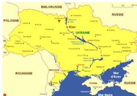
Figure 1. L'Ukraine