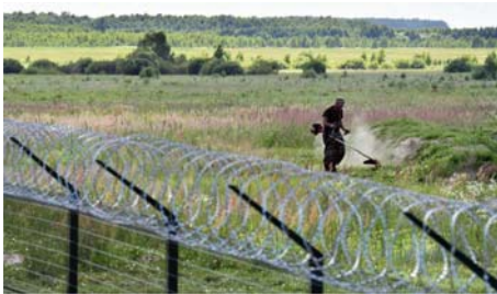
Figure 3. Le mur ukrainien