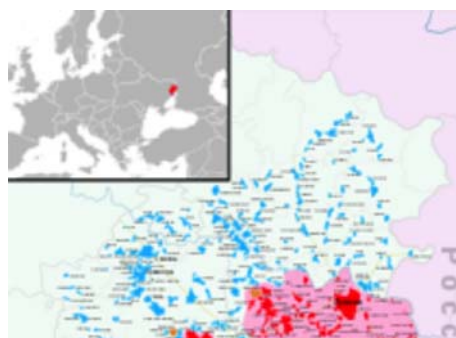
Figure 2. Les territoires sous le contrôle des séparatistes pro-russes