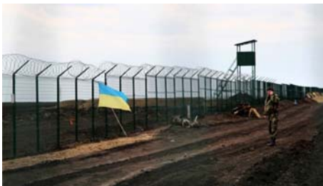
Figure 4. À la frontière russo-ukrainienne près Hoptivka, région de Kharkiv, Ukraine orientale, le 18 avril 2015.