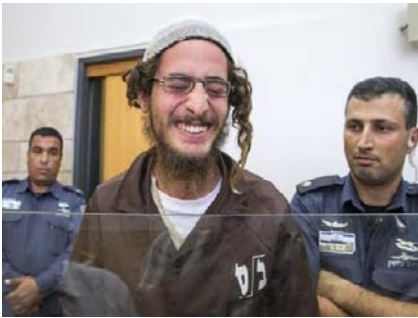
Photo : Meir Ettinger, chef d'un groupe religieux extrémiste, comparait devant le tribunal israélien de Nazareth le 4 août 2015 après son arrestation pour « crime nationaliste » (AFP).

Tweet (8) Tweet ( http://twitter.com/share ) ? 5