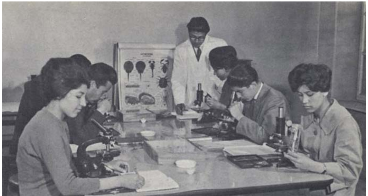
Classe de Biologie, Université de Kaboul

Dans les années 1950s and 1960, les femmes pouvaient poursuivre des carrières professionnelles dans des domaines comme la médecine. Aujourd'hui, les écoles éduquant les femmes sont la cible de violences, encore plus aujourd'hui qu'il y a cinq ou six ans.