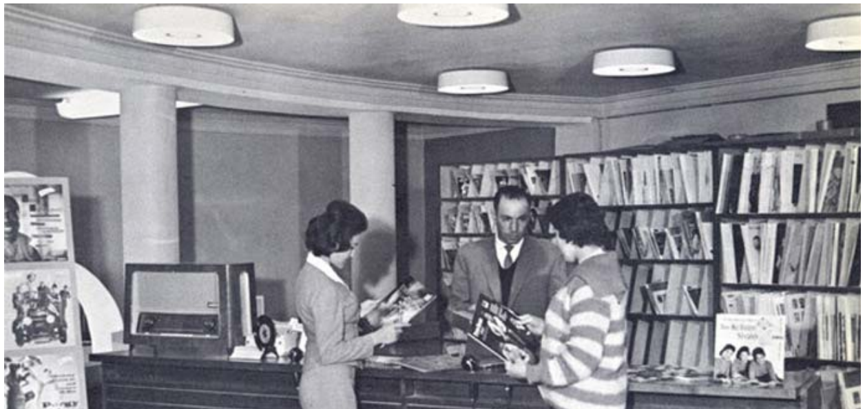
Magasin de disques

Dans les années 1950s and 1960, les femmes pouvaient poursuivre des carrières professionnelles dans des domaines comme la médecine. Aujourd'hui, les écoles éduquant les femmes sont la cible de violences, encore plus aujourd'hui qu'il y a cinq ou six ans.