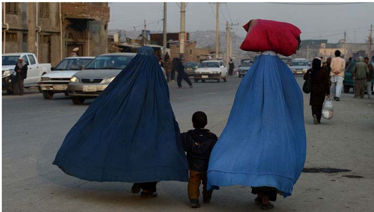
Femmes afghanes aujourd'hui