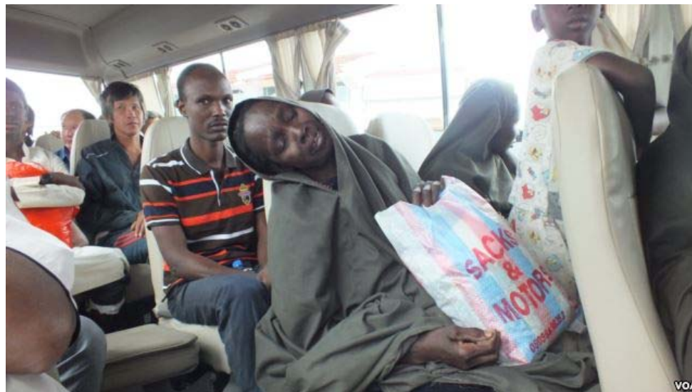
Après des mois de captivité par des militants présumés de Boko Haram, des ex-otages arrivent à l'aéroport international de Nsimalen, à Yaoundé, au Cameroun.

Les retombées de la Libye s'étendent cependant encore plus loin. En 2016, des responsables américains ont relevé des indications selon lesquelles les djihadistes nigériens de Boko Haram, responsables de nombreux attentats et enlèvements, envoyaient des combattants rejoindre l'EI en Libye, et que la coopération entre les deux groupes s'était accrue. L'International Crisis Group note que c'est l'arrivée d'armes et d'expertise de la Libye et du Sahel qui a permis à Boko Haram de conduire l'insurrection qui sévit actuellement dans le nord-ouest du Nigeria. Il y a même eu des allégations selon lesquelles Boko Haram rend des comptes à des commandants de l'EI en Libye.