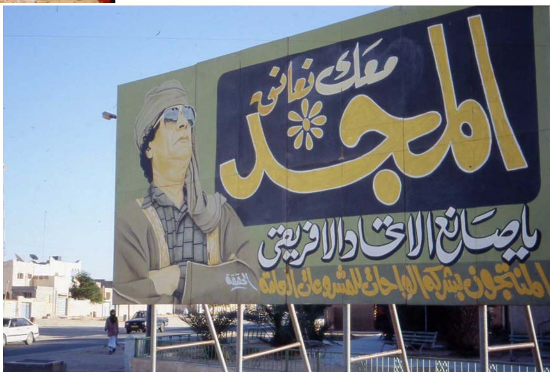
Portrait de Kadhafi, Ghadames, Libye, 2009.

Huit ans après la guerre de l'OTAN en Libye de 2011, alors que le pays entre dans une nouvelle phase de son conflit, j'ai fait le point sur le nombre de pays dans lesquels le terrorisme s'est propagé comme un produit direct de cette guerre. Le nombre est d'au moins 14. L'héritage de l'élimination du dirigeant libyen Mouammar Kadhafi – par le Premier ministre britannique David Cameron, le Président français Nicolas Sarkozy et le Président américain Barack Obama – a été durement ressenti par les Européens et les Africains. Pourtant, la perspective de tenir ces dirigeants pour responsables de leur décision de partir en guerre est plus éloignée que jamais.