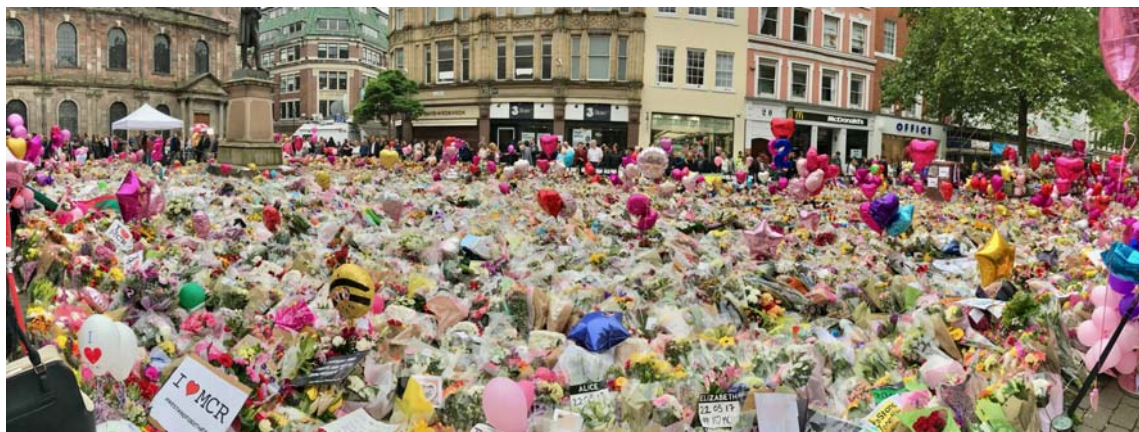
Hommages floraux aux victimes de l'attaque sur St Ann's Square au centre de Manchester.

complots terroristes. « La plupart du sang versé en Europe lors des attaques les plus spectaculaires, à l'aide d'armes à feu et de bombes, tout a commencé au moment où Katibat al-Battar est retourné en Libye », a déclaré Cameron Colquhoun, un ex-analyste antiterroriste au Centre britannique d'interception des télécommunications étrangères (GCHQ) au New York Times . « C'est là que la trajectoire de la menace pour l'Europe a commencé, quand ces hommes sont rentrés en Libye et ont pu prendre leurs aises. »