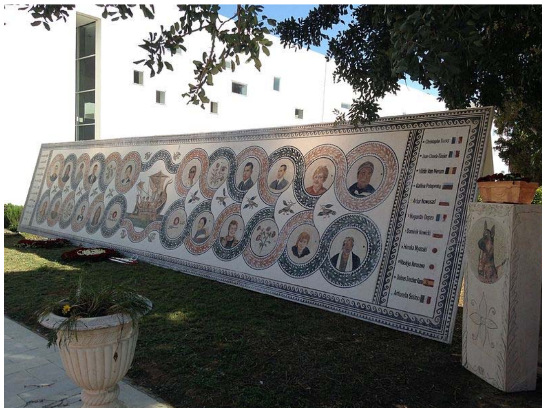
Mémorial aux victimes de l'attaque du Musée national du Bardo en Tunisie.

Salman Abedi, qui a fait exploser 22 personnes lors d'un concert pop à Manchester en 2017, avait rencontré plusieurs fois des membres du Katibat al-Battar al-Libi, une faction de l'EI à Sabratha, où il avait probablement été formé. Parmi les autres membres du KBL figuraient Abdelhamid Abaaoud , le meneur des attentats de Paris de 2015 contre le Bataclan et le stade de France, qui ont fait 130 morts, et les militants impliqués dans le complot de Verviers contre la Belgique en 2015. L'auteur de l'attentat de Berlin de 2016, qui a fait 12 morts, a également eu des contacts avec des Libyens liés à l'EI. Il en va de même en Italie, où l'activité terroriste a été liée à l'EI Libye, avec plusieurs individus basés en Italie impliqués dans l'attaque du musée du Bardo à Tunis en 2015, qui a fait 22 morts.