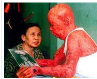
Ancien militaire vietnamien tenant son portrait avant sa contamination par l'Agent Orange