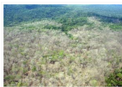
Une partie de la forêt amazonienne empoisonnée par l'Agent Orange

« Agent Orange est l'une des armes les plus dévastatrices de la guerre moderne, un produit chimique qui a tué ou blessé quelque 400.000 [hélas, bien davantage !] personnes au cours de la guerre du Viêt Nam – et maintenant il est utilisé contre la forêt amazonienne. Selon les responsables, les éleveurs au Brésil ont commencé la pulvérisation de l'herbicide hautement toxique sur des parcelles de forêt comme méthode secrète pour effacer illégalement feuillage, plus difficiles à détecter que des tronçonneuses et des tracteurs. Au cours des dernières semaines, un relevé aérien détecté quelques 440 hectares de forêt qui avaient été pulvérisés avec le composé – empoisonnant des milliers d'arbres et un nombre incalculable d'animaux selon IBAMA (Agence de l'environnement du Brésil) – ont d'abord été pressenti pour le défrichage illégal constaté par des images satellites de la forêt en Amazonie. Plus tard, un survol en hélicoptère dans la région révéla des milliers d'arbres laissés couleur de cendre et défoliés par des produits chimiques toxiques. IBAMA déclare que l'Agent Orange a probablement été dispersés au moyen d'un avion par un fermier encore non identifié pour défricher la terre pour le pâturage, car il est plus difficile à détecter que les opérations traditionnelles qui nécessitent des tronçonneuses et des tracteurs.