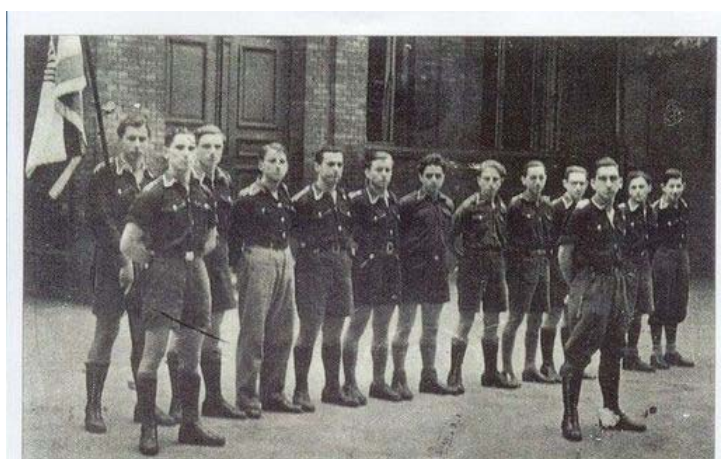
Troops of Betar in Uniform Berlin 1936

Pour l'Allemagne fasciste, la collaboration avec la tendance sioniste majoritaire était sans aucun doute plus importante que la coopération avec « l'opposition » révisionniste. Néanmoins, même les Révisionnistes furent autorisés à poursuivre leurs activités politiques en Allemagne. Les membres de l'organisation de jeunesse du mouvement révisionnistes, « Brit Trumpeldor » (à propos de laquelle Schechtman rapporte qu'elle « s'adaptait à certaines caractéristiques du régime nazi ») était la seule organisation non fasciste en Allemagne à être autorisée par les nazis à porter un uniforme.