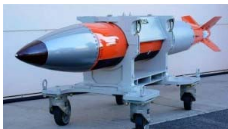
A B61-12 nuclear weapon

59. En cette période d'après-guerre froide, on ne semble plus se soucier de ce qu'implique une guerre nucléaire (destruction mutuelle assurée). Des documents militaires accessibles au public confirment qu'une guerre nucléaire préventive est toujours envisagée par le Pentagone. Comparativement aux années 1950, les armes nucléaires sont plus perfectionnées. Les vecteurs nucléaires sont plus précis.