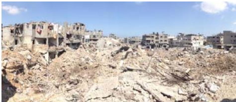
( http://arretsurinfo.ch/wp-content/uploads/2014/10/gaza-26-july-scene-of-massive-destruction-of-homes.jpg )

Twitter ( http://twitter.com/share ) ? 21