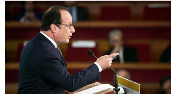
( http://arretsurinfo.ch/wp-content/uploads/2015/07/hollande.jpg )