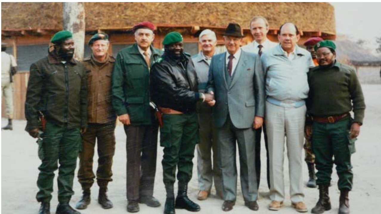
Jonas Savimbi recevant ses parrains sud-africains dans sa « capitale » de Jamba, en Angola

Malgré ces opérations terroristes meurtrières en Angola, appuyées par les USA, les forces cubaines ont repoussé les agresseurs sud-africains vers le sud, les forçant à quitter la Namibie, illégalement occupée, et à ouvrir la voie à des élections, pour lesquelles Savimbi, après sa défaite, « a complètement rejeté les avis de 800 observateurs internationaux, qui disaient que ces élections avait été... globalement libres et justes » (New York Times). Savimbi a continué sa guérilla terroriste, grâce au soutien US.