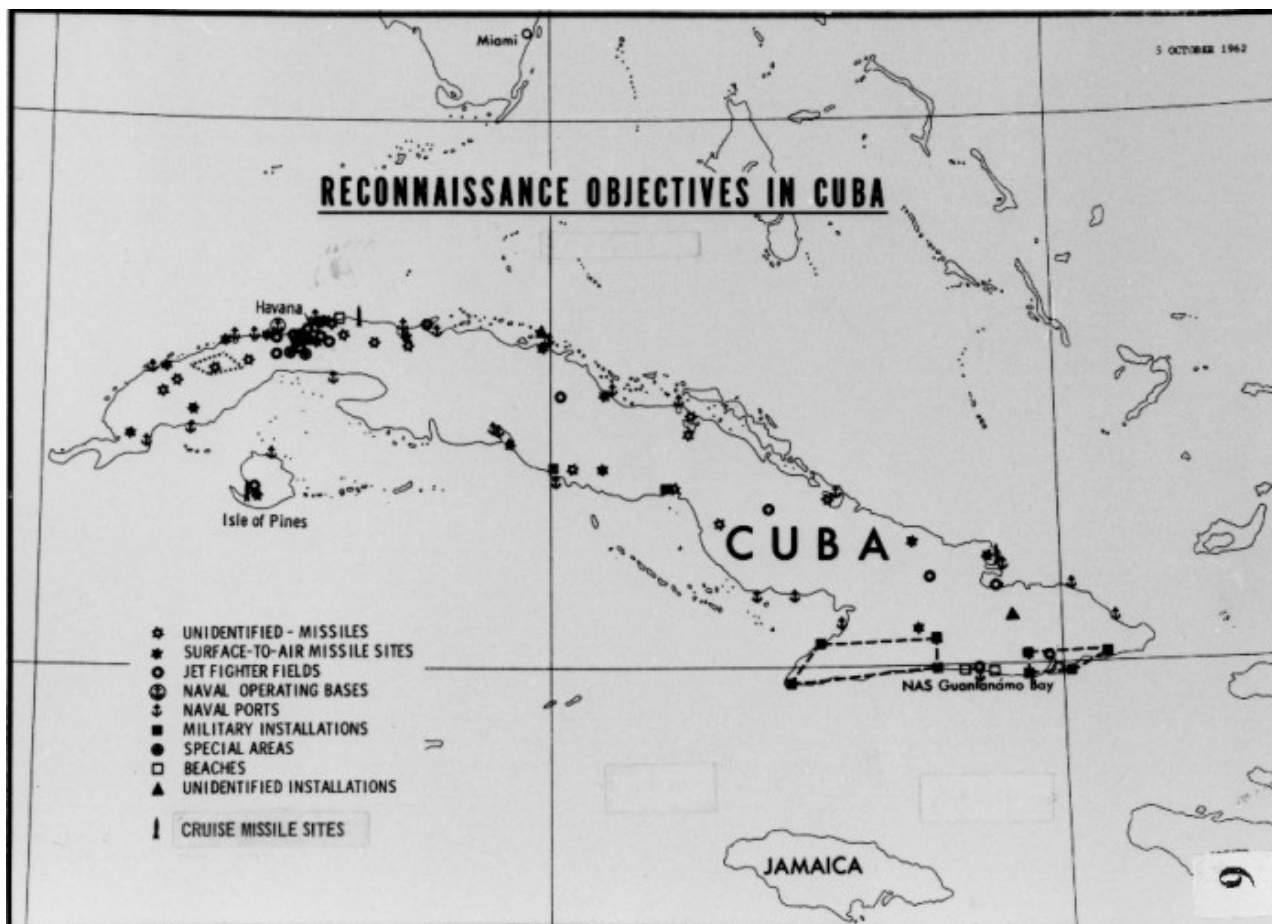
Objectifs de reconnaissance de l'US Air Force à Cuba, 1962.

L'analyste politique Raymond Garthoff, très reconnu dans son milieu, et ayant de nombreuses années d'expérience directe du renseignement US, a rapporté que pendant les semaines qui ont précédées la crise d'octobre, un groupe terroriste cubain, basé en Floride avec l'autorisation du gouvernement US a entrepris « une attaque osée à base de vedettes rapides sur un hôtel de bord de plage cubain, près de La Havane, où des techniciens militaires avait l'habitude de se réunir, tuant une dizaine de Russes et de Cubains ». Peu de temps après, rajoute-t-il, les forces terroristes attaquèrent des cargos britanniques et cubains et organisèrent d'autres raids sur Cuba, entre autres actions entreprises début octobre. À un moment particulièrement tendu de cette crise encore non résolue, le 8 novembre, une équipe terroriste envoyée des USA a fait exploser une usine cubaine alors que l'opération Mongoose avait déjà été officiellement arrêtée. Selon Fidel Castro, 400 ouvriers ont été tués dans cette opération menée grâce à « des photos prises par des avions espions ». Des tentatives d'assassinat de Castro et d'autres attaques terroristes ont continué, et se sont même aggravées, les années suivantes.