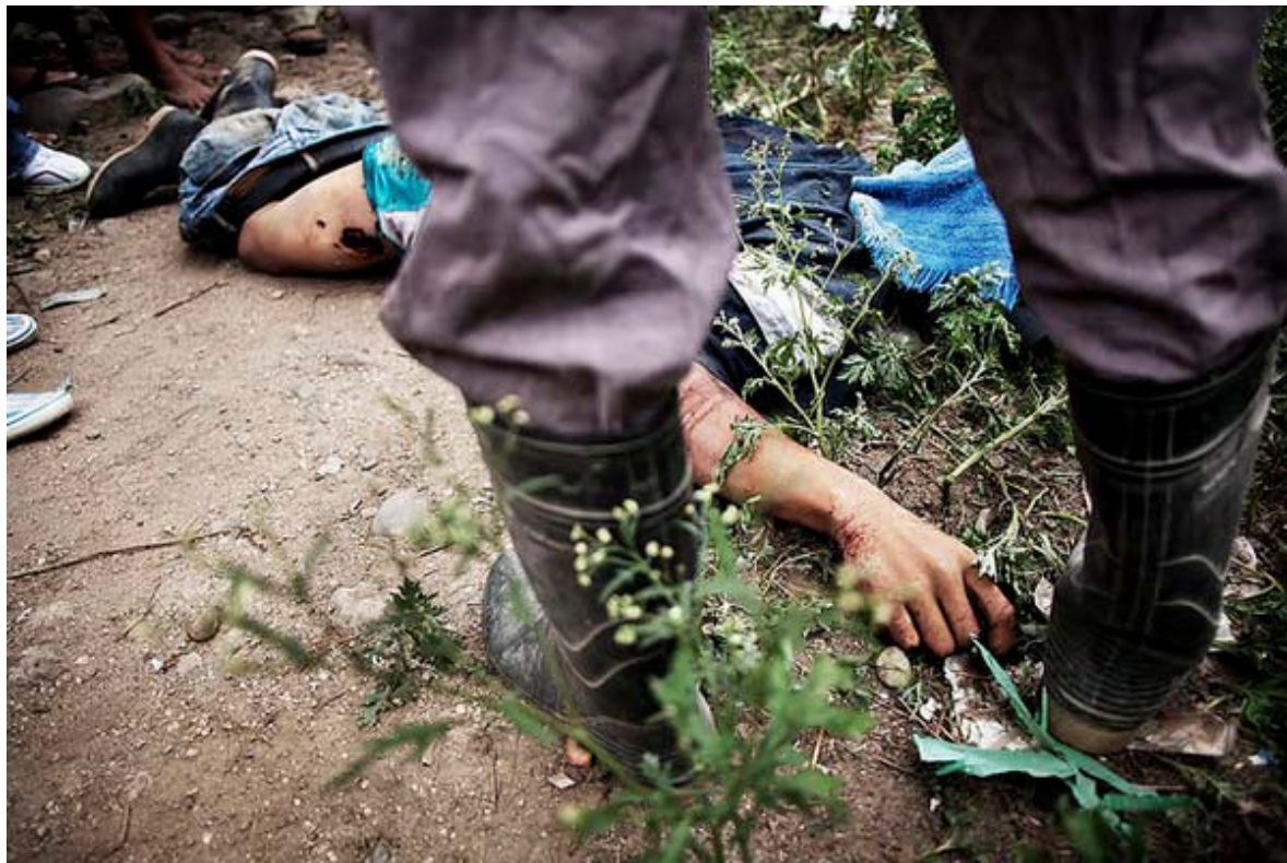
Meurtre d'un paysan à Bajo Aguán, au Honduras.

En réalité, pour les populations rurales, les terres ne sont pas qu'un gagne-pain. Les terres et les territoires sont le fondement même de leur identité, leur paysage culturel et leur source de bien-être. Et pourtant, ces terres leur sont arrachées et elles se retrouvent détenues par un nombre de personnes de plus en plus réduit, le tout à un rythme alarmant.