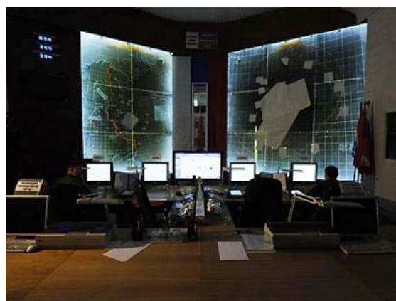
La salle de contrôle de la 4ème brigade de défense aérienne et spatiale dans la région de Moscou.