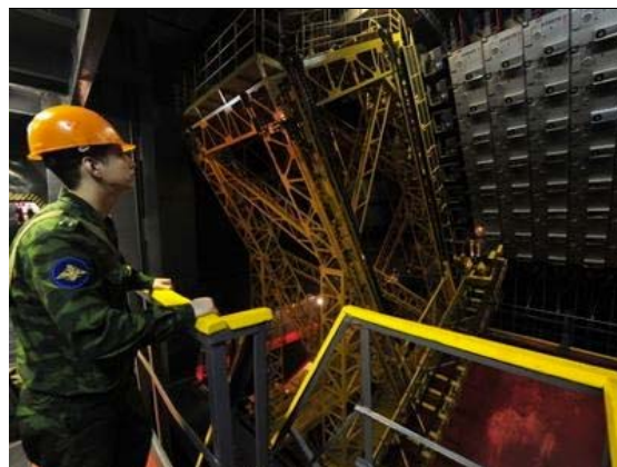
Nouveau système de surveillance radar testé sur l'espace extra-atmosphérique

Selon Borisov, plusieurs nouvelles usines sont en construction dans la région de Kirov et Nijni Novgorod pour permettre à la Russie d'acquérir cette capacité de défense. Le coût de ces nouvelles usines est estimé à plus de 36 milliards de roubles (soit 1 milliard de dollars).