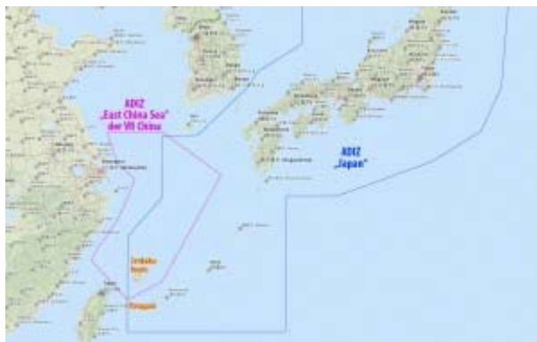
Adiz japonaise et chinoise