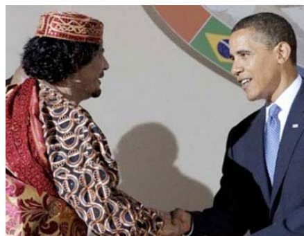
Et Barack Obama, le petit nouveau.