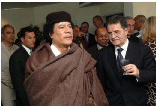
Avec Romano Prodi, quand il présidait la Commission européenne.