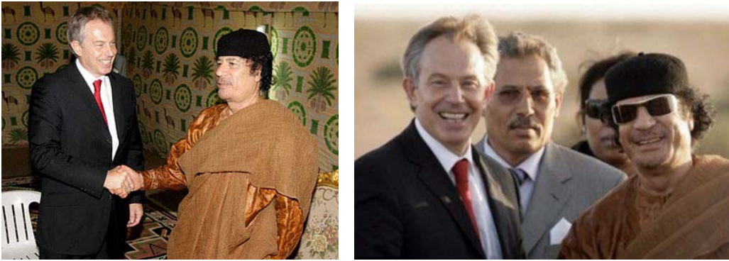
Avec mon conseiller salarié Tony Blair