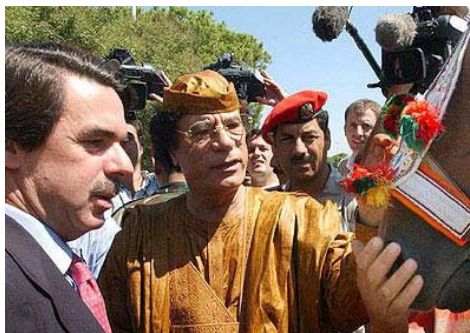
Avec José María Aznar, toujours un peu réservé