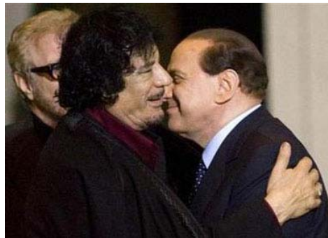
ça, c'est Silvio Berlusconi. On était inséparables. Et on en a fait ensemble des coups pendables à Sarko !