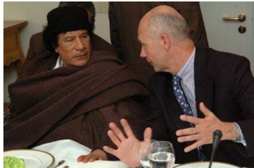
Avec Pascal Lamy, à l'époque, il était commissaire européen, pas encore Directeur Général de l'Organisation Mondiale du Commerce