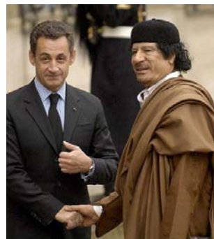
Nicolas Sarkozy. Après tout ce que j'ai fait pour lui, il a comploté pour me renverser. Je ne sais pas ce qu'il ne m'a pas pardonné : les Rafales ? les centrales nucléaires ? ou sa Cécilia ?